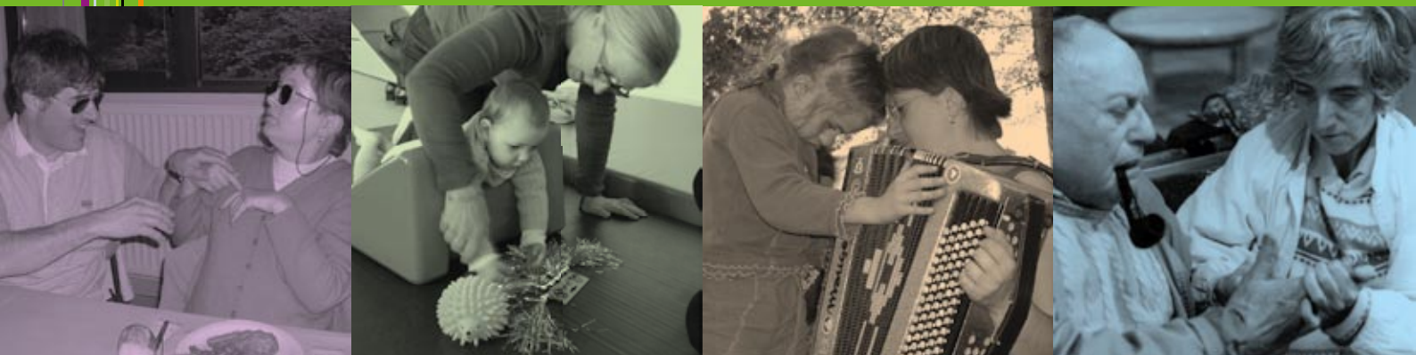
SCHÉMA NATIONAL D'ORGANISATION SOCIALE ET MÉDICO-SOCIALE POUR LES HANDICAPS RARES 2009-2013

A ttendu par les personnes confrontées à des handicaps rares et leur famille, par les professionnels chargés de l'évaluation et de l'accompagnement de ces situations très complexes, le premier schéma national d'organisation sociale et médico-sociale pour les handicaps rares a été adopté par le ministre du Travail, des Relations sociales, de la Famille, de la Solidarité et de la Ville et la secrétaire d'État chargée de la Famille et de la Solidarité.